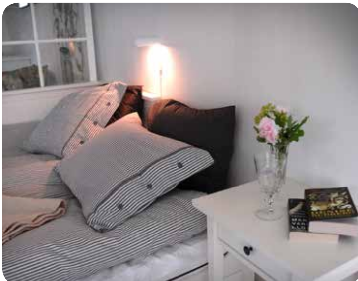
Blomsterhuset bed och Breakfast.