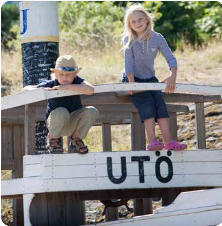
Klättersugna barn på träbåt på Utö.