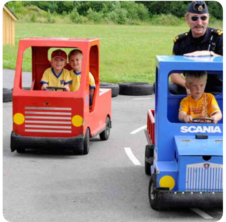
I Nykvarn kan man köra lådbil.