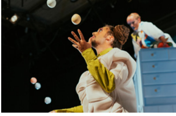
Kompani giraff.

Arrangör: Haninge kultur i samarbete med Haninge Riksteaterförening med stöd av Dans i Stockholms stad och län (DIS).