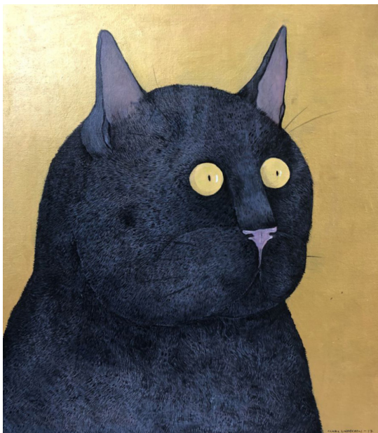
Clara Lindgren 2017, "Sigge", akryl