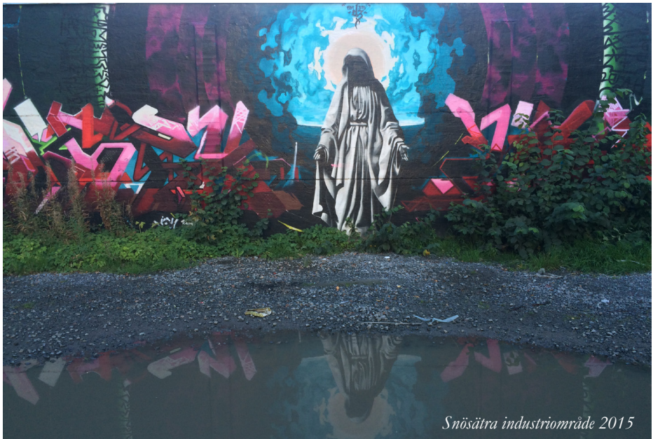
Snösätra industriområde 2015

Anmälan görs till lotta.gusterman@haninge.se