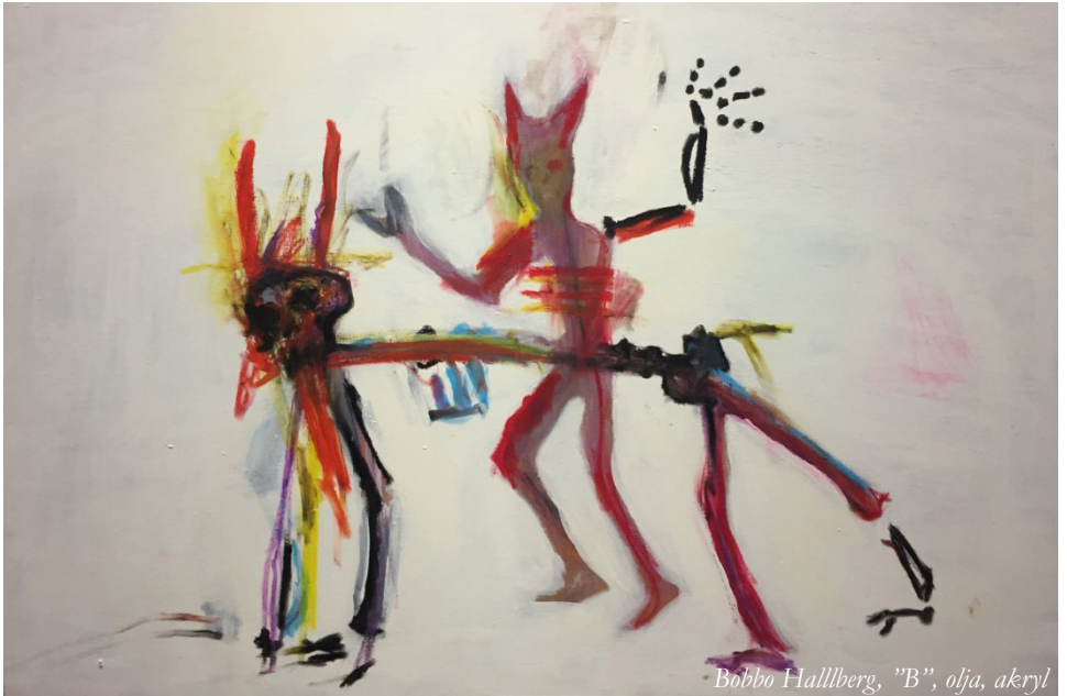
Bobbo Halllberg, "B", olja, akryl