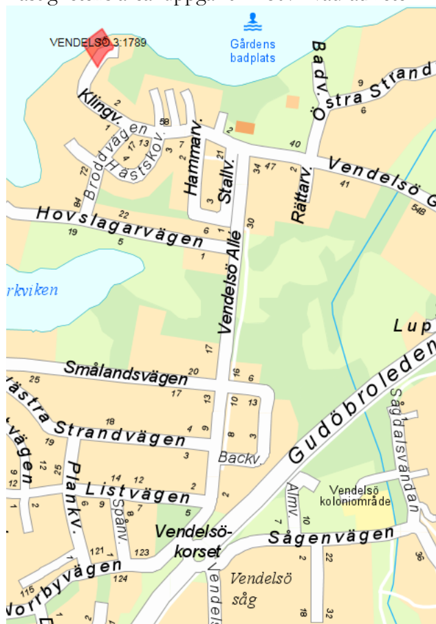
Figur 1: Översiktskarta över området samt fastigheten markerad med röd polygon

Fastighetens areal uppgår till 1807 kvadratmeter.