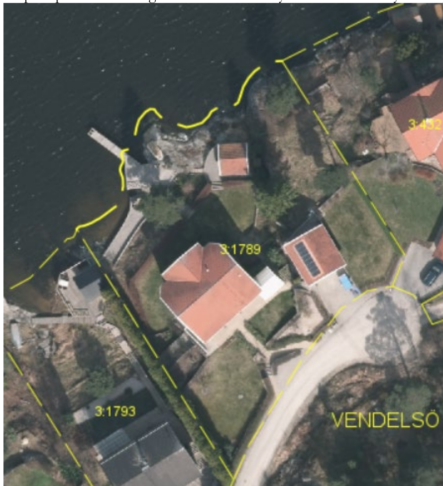
Figur 4: Ortofoto över fastigheten och hur marken är ianspråktagen

Enligt 7 kap. § 18 c kan strandskydd upphävas inom en detaljplan om det finns särskilda skäl som motiverar detta. Planavdelningen bedömer att marken är ianspråktagen och att det särskilda skäl som råder enligt Miljöbalkens 7 kap. § 18 c, punkt 1 uppfylls då området redan har tagits i anspråk på ett sätt som gör att det saknar betydelse för strandskyddets syften.