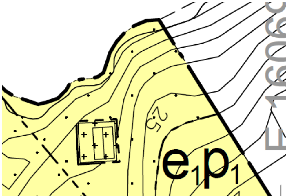
Figur 3: Utsnitt ur plankarta upprättad 2020-02-28. Redovisande av utlagd korsmark vid befintlig sjöbod. Resterande mark regleras med prickmark.

En sjöbod har uppförts enligt gällande detaljplan D-66 och denna sjöbod befästs i planändringen då korsmark med begränsningen ”endast sjöbod om 15 kvadratmeter byggnadsarea får uppföras. Högsta nockhöjd är 3 meter” införs som planbestämmelse på den plats där sjöboden är uppförd.