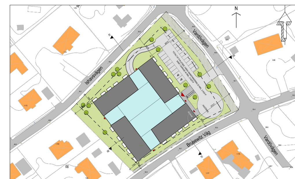
Möjlig placering av ett flerbostadshus (Liljewall arkitekter) på uppdrag av Boverian AB).

Detaljplanen är upprättad i enlighet med PBL 2010:900