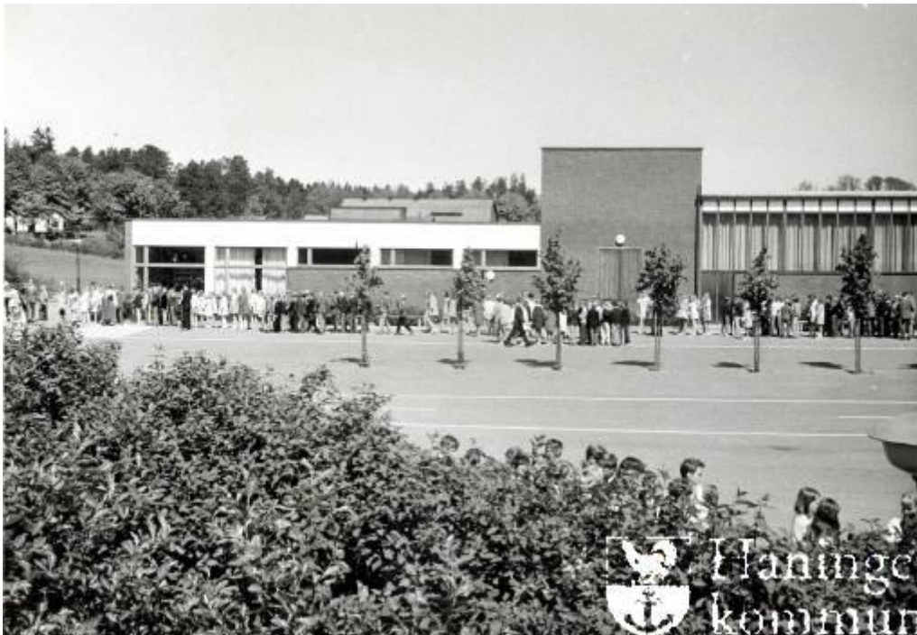
Här syns Ribby II med de ursprungligen höga fönsterpartierna mot aulan.

Invändigt är bl.a. trapphusen tidstypiska, med fina trähandledare. Aulan i byggnaden hade ursprungligen större fönster, men taket är sänkt med moderna akustikplattor. De många runda opalglaslamporna finns kvar i aulans tak.