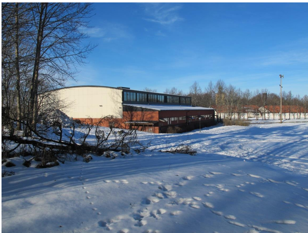
LP_2015_00055 Hallen sedd från söder, med Ribby I t.h. och kyrkan bakom träden.