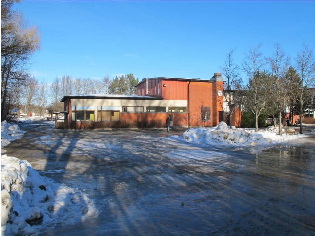
LP_2015_00049 Södra sidan och skolgården. Jämför med det historiska fotot från Haninge kommun. T.h. i längan ligger aulan.