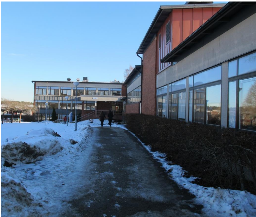
LP_2015_00043 Ribby II sedd från väster med norrfasaden i bild och huvudingången i bakgrunden.