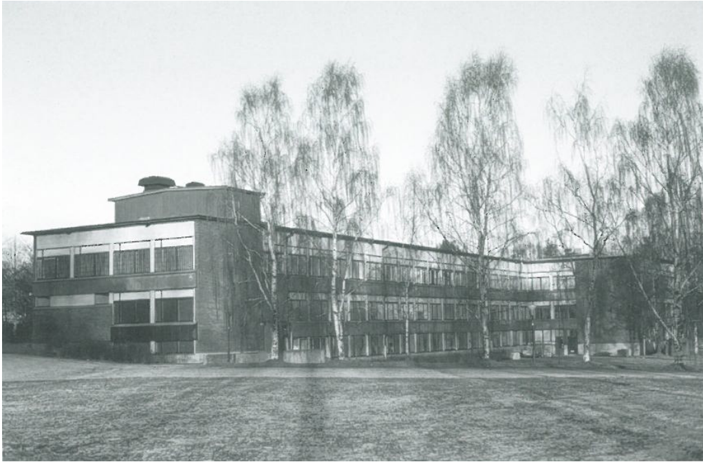
Forografi av Ribby II taget från sydost. Fotografiet är relativt sentida.