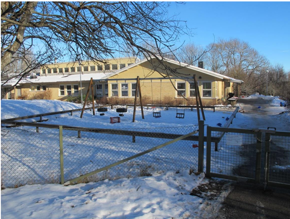
LP_2015_00056 Förskolebyggnaden ligger en liten bit mot sydost och syns inte från skolan, utan döljs av naturområdet.