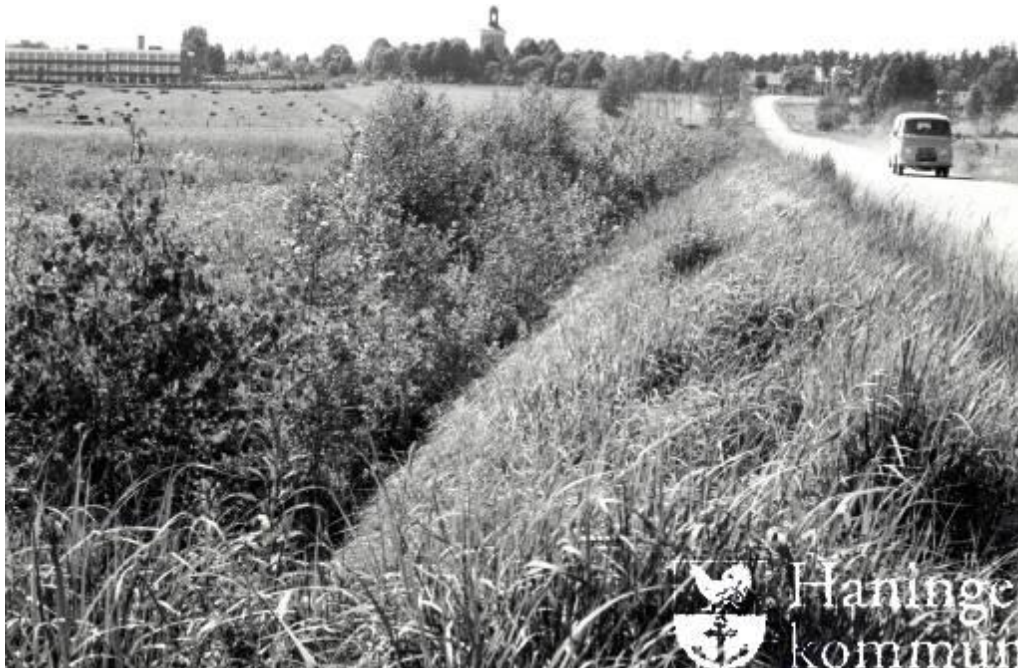
Foto taget från norr med Ribby II t.v. i bild. Foto från omkring 1960-talet.

Strax över Nynäsvägen, i nordvästlig riktning, ligger Västerhaninge kyrka och kyrkogård. Kyrkan är i sina äldsta delar från 1200-talet. I rakt västlig riktning över Nynäsvägen ligger Sotholms-Härads tingshus från 1730-talet, samt ytterligare några äldre hus.