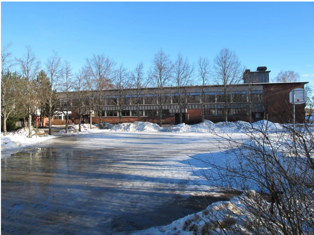
LP_2015_00050 Skolgården med en västfasad på gården i bild. Träden är placerade i en L-form på skolgården.