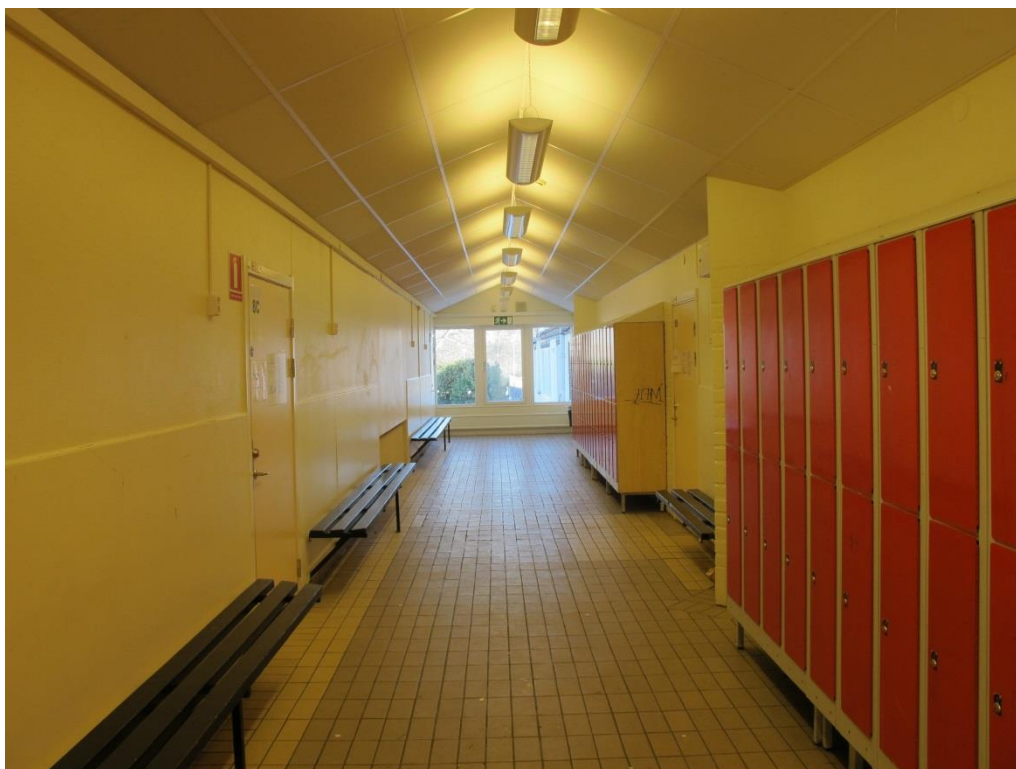
LP_2015_00042 En korridor i Ribby I, som har ett tydligt bruksslitage.