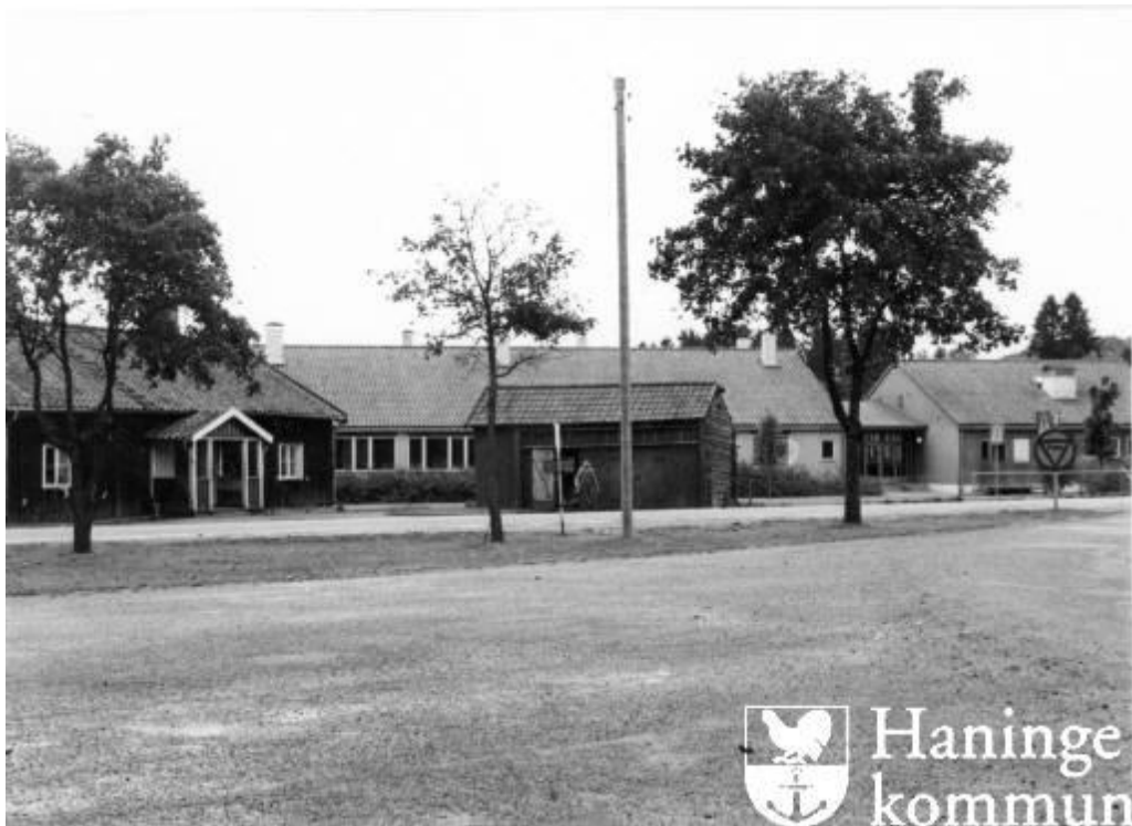
Här syns de gamla byggnaderna i Ribby I 1960. T.v. i bild syns ovanför fönstren också vad som troligen är samma kyrkspånsdetaljer som idag. Bilden är troligen tagen från nordväst.