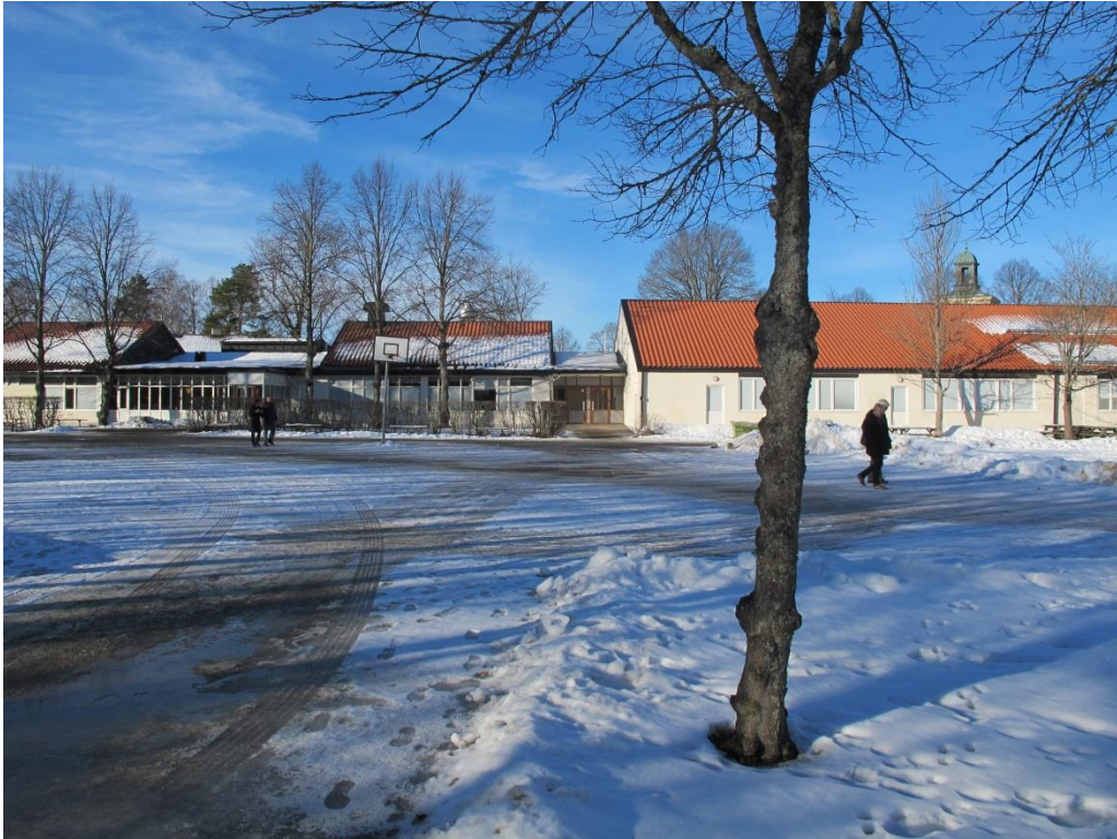
LP_2015_00034 Ribby I med närliggande Västerhaninge kyrka skymtandes ovanför taknocken t.h. Foto taget från öster.