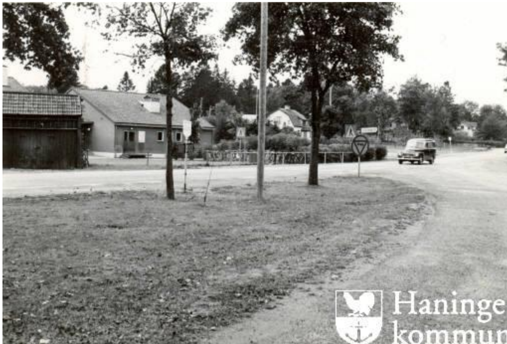
Här syns Ribby I från nordväst 1960, med en av de ursprungliga byggnadskropparna i bild. Fasaderna tycks ha en något mörkare beige puts än dagens.

Utformningen på Ribby I stämmer överens med 1950-talets husskala, med en låg, jordnära byggnadskropp i mänsklig skala, ljusa putsade fasader och breda sadeltak. Form- och volymmässigt är de ursprungliga huskropparna i Ribby I oförvanskade, och de något senare tilläggen är utförda i fin överensstämmelse med den ursprungliga arkitekturen. Fönstersättningen är till synes också oförändrad.