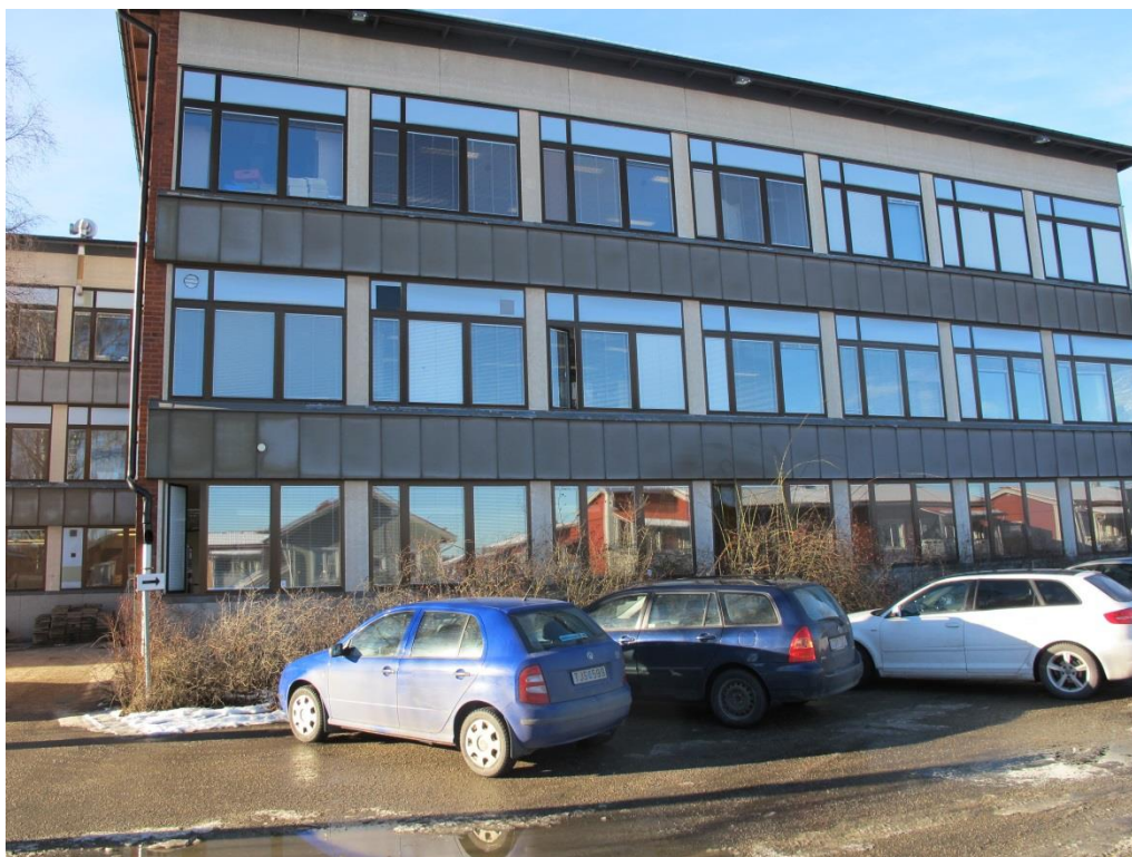
LP_2015_00047 Östra sidan av Ribby II.