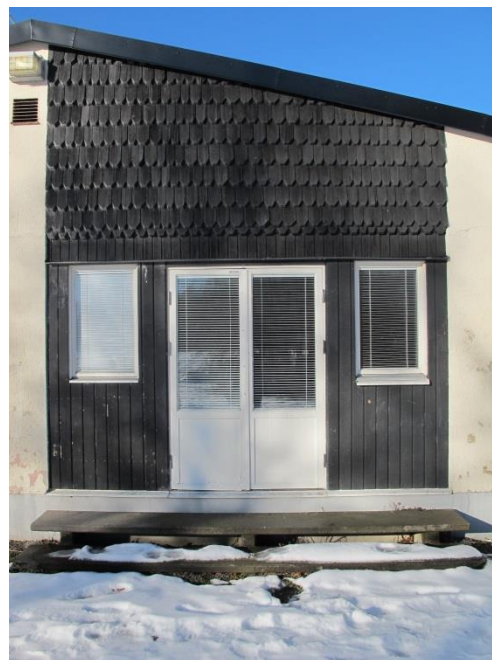
LP_2015_00039 Foton från östsidan. T.v. en tidstypisk "balkongdörr". LP_2015_00040 T.h. syns ett fasadparti klätt med bl.a. kyrkspån.