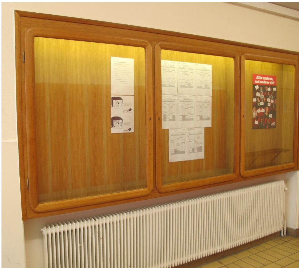
LP_2015_00041 Invändigt i skolbyggnaden finns bl.a. detta anslagsskåp, i sin utformning a lå 1950-tal.