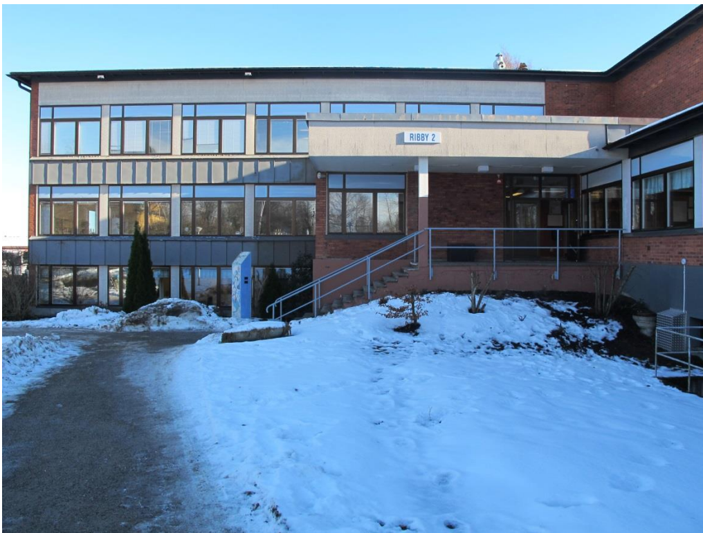
LP_2015_00046 Ingången mot norr i Ribby II.