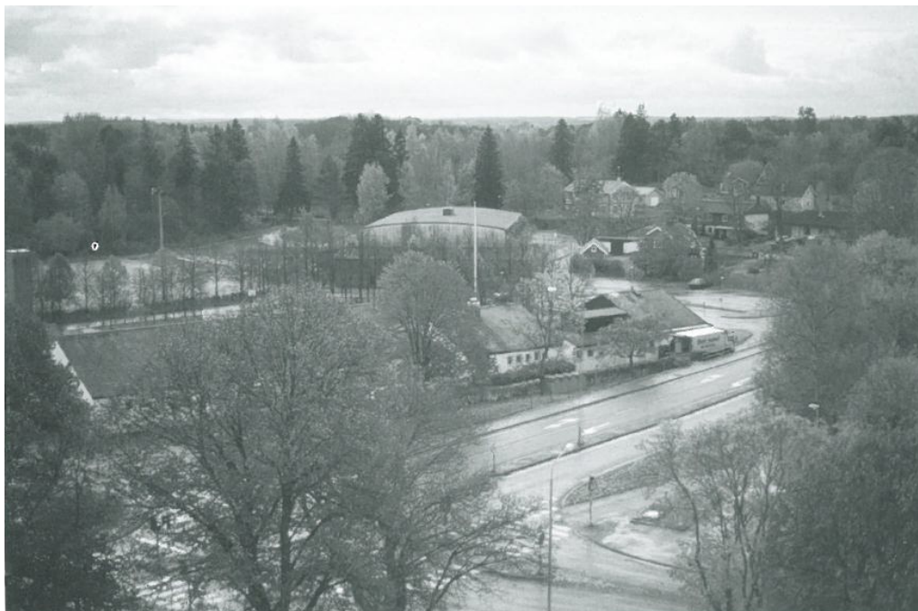
Fotografi över Ribby I och Idrottshallen troligen taget från kyrkans torn, från nordväst. Här syns den fullt utbyggda Ribby I, vilket placerar fotot efter 1986. Foto ur Västerhaninge i gamla och nya bilder, Hilding Eklund och Olle Flodby.