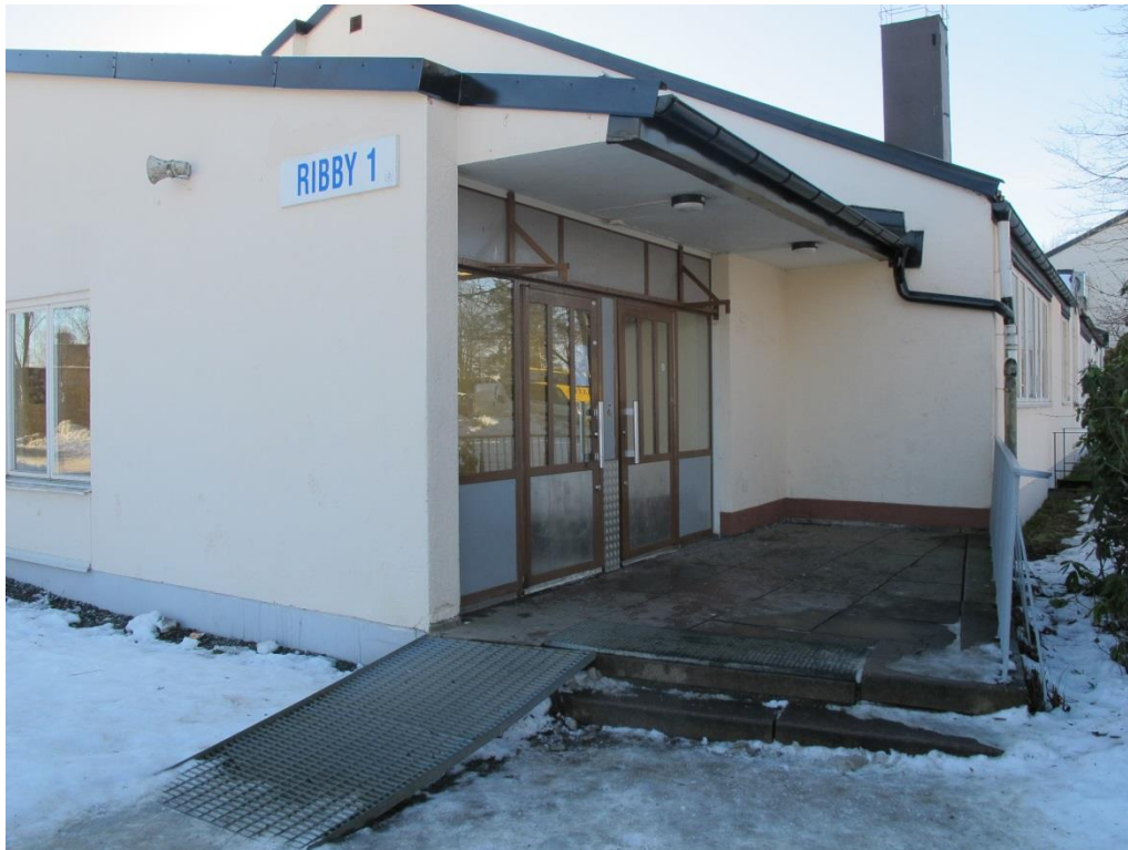
LP_2015_00038 Foto från den nordvästra ingången.