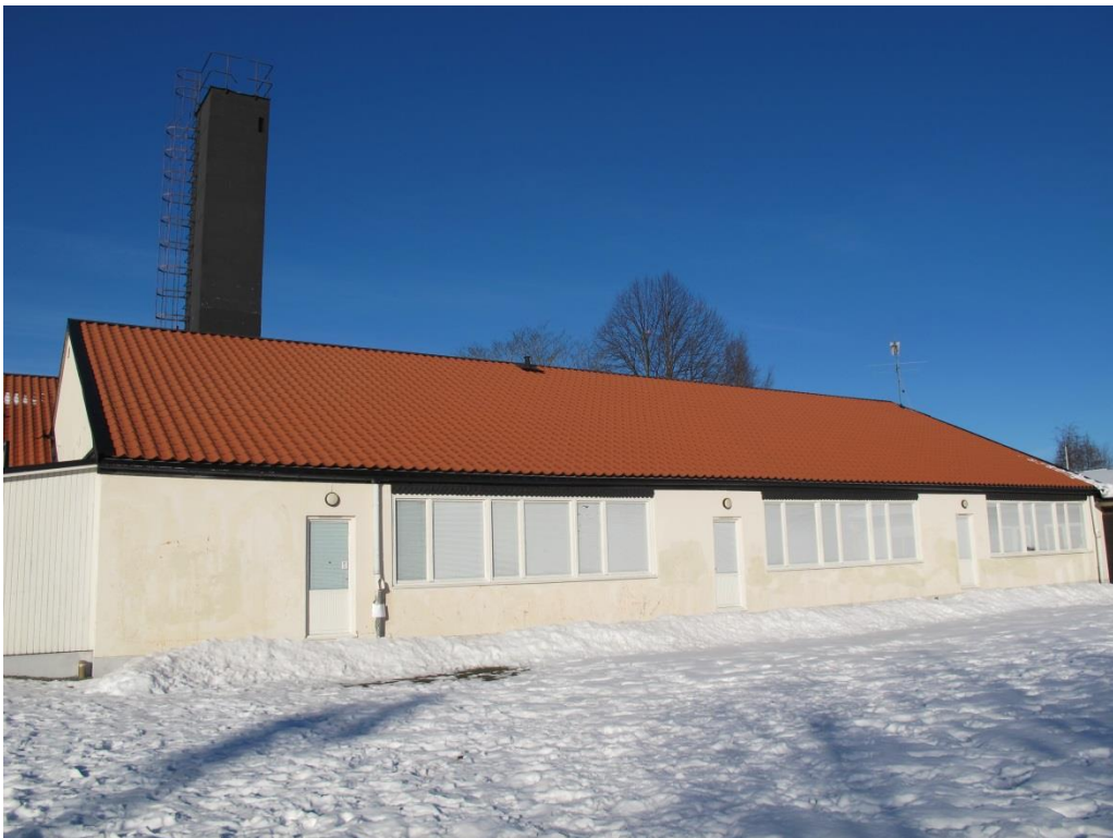
LP_2015_00035 Foto från öster som visar en av de ursprungliga huskropparna, med kyrkspånsdetaljer ovanför fönstren.