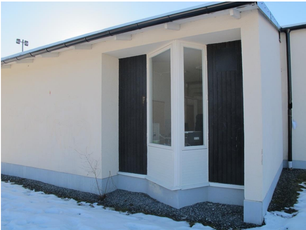
LP_2015_00037 Foto av Ribby I från norrsidan.