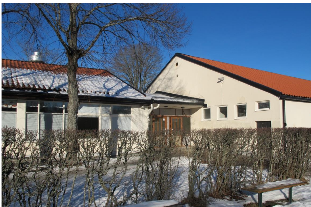
LP_2015_00033 Möte mellan ursprunglig huskropp t.h. och den tillbyggda matsalen t.v. Foto taget från öster.