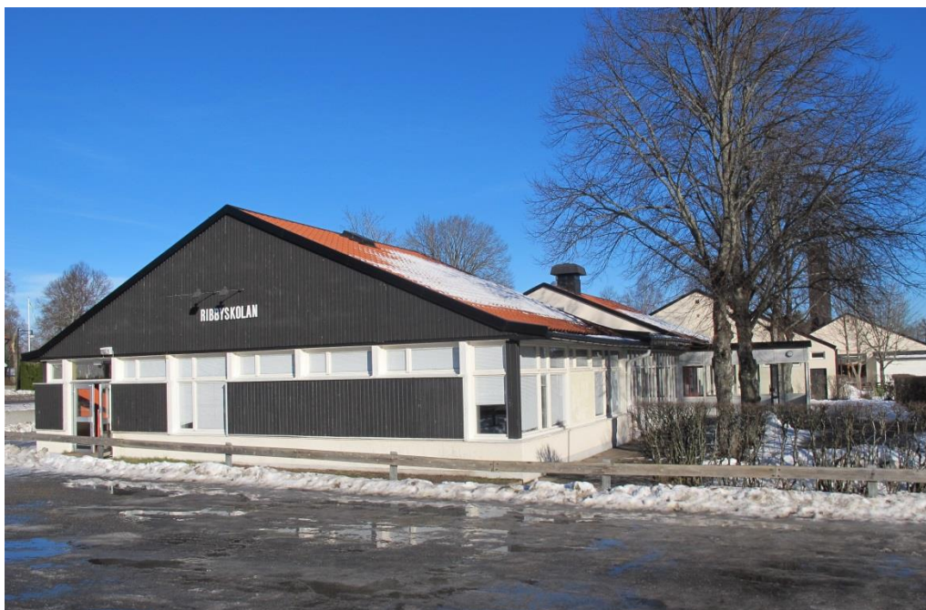
LP_2015_00032 Ribby I sedd från söder. I förgrunden syns matsalsbyggnaden och i bakgrunden resten av skolbyggnaden.