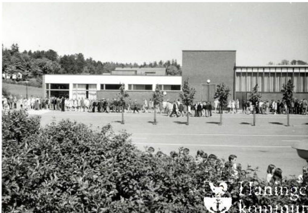
Här syns Ribby II med de ursprungligen höga fönsterpartierna mot aulan.

Invändigt är bl.a. trapphusen tidstypiska, med fina trähandledare. Aulan i byggnaden hade ursprungligen större fönster, men taket är sänkt med moderna akustikplattor. De många runda opalglaslamporna finns kvar i aulans tak.