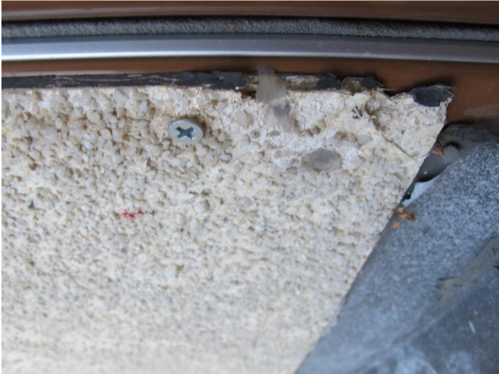
LP_2015_00051 Fasaden täcks på några ställen av tunna fiberisoleringsplattor som liknar en ballastputsad fasad.