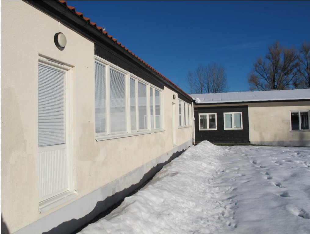
LP_2015_00036 Foto taget mot norr på den östra sidan. Här syns en relativt rik detaljeringsgrad i fasaddetaljerna.