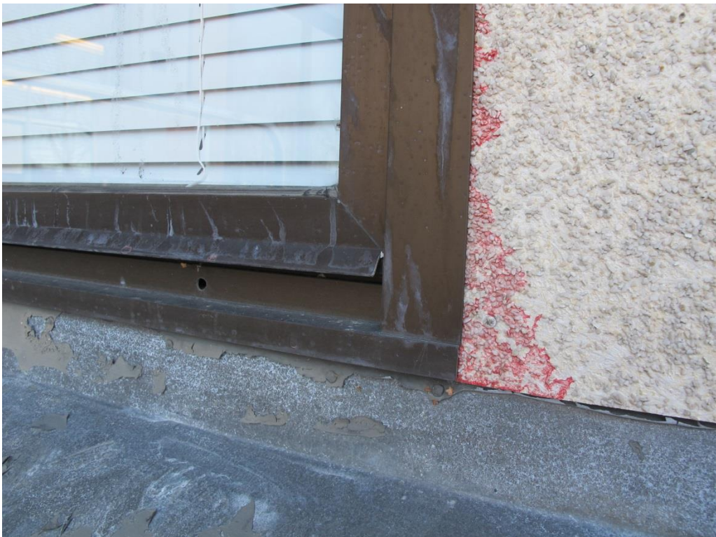
LP_2015_00052 Fasaddetaljer, tegel, fiberplatta och fönsteromfattning i mässingsfärgad plåt. Foto taget på östra sidan.