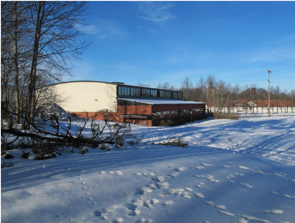
LP_2015_00055 Hallen sedd från söder, med Ribby I t.h. och kyrkan bakom träden.