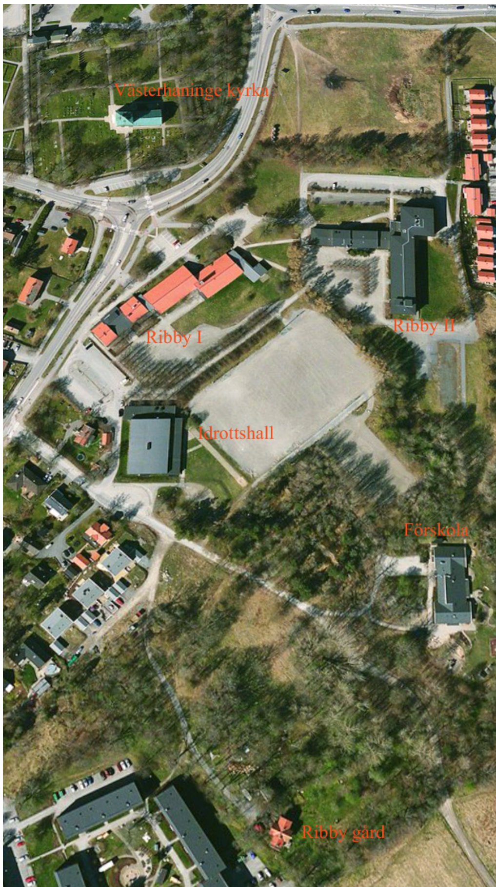
Satellitbild över skolområdet och näromgivningarna. Karta från Apple Maps.