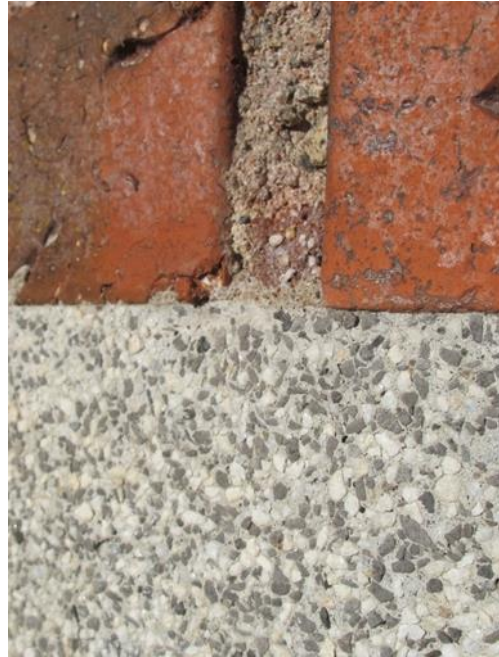
LP_2015_00044 och LP_2015_00045 Fasaduttryck i nordväst samt inzoomad fasad mot väster.