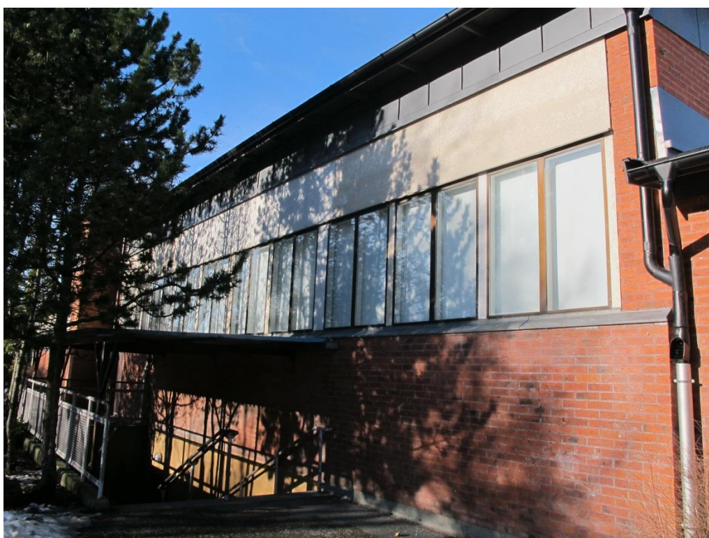
LP_2015_00048 Fönstren utanför aulan har minskats i höjd.