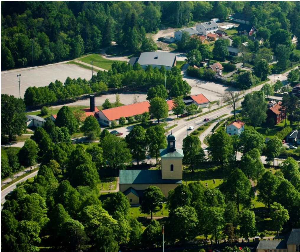
Ribby I och Idrottshallen sedda från nordväst, med Västerhaninge kyrka i förgrunden. På bilden syns hur lummiga lövträd leder i en allé mellan skolplanen vid Ribby I och fotbollsplanen i bakgrunden.

Skolområdet breder ut sig på en större yta och centreras av en bollplan. Området är gräsbevuxet kring skolbyggnaderna, som inhägnas av flera lövträd. Bl.a. leder en lövträdsallé mellan Idrottsanläggningen och Ribby II. I öster tar ett skogsparti vid.