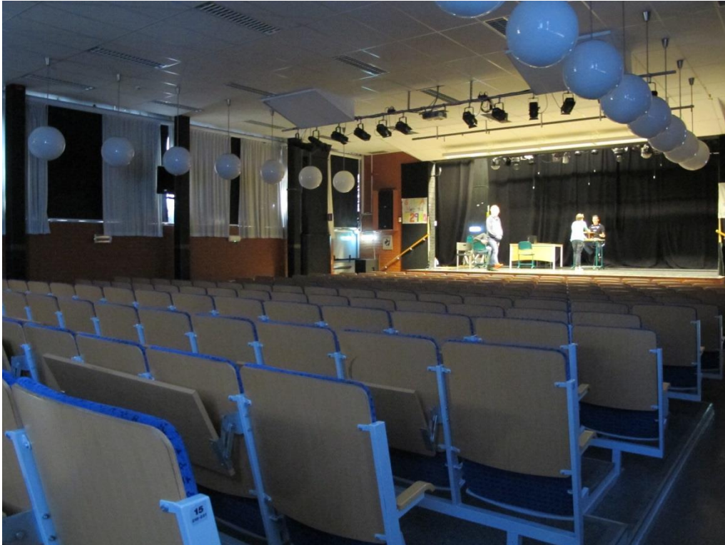
LP_2015_00053 Bild från aulan i Ribby II, där taket är sänkt på bekostnad av de tidigare höga smala fönstren (täckta av gardiner), men där lamporna är bevarade i en u-form.