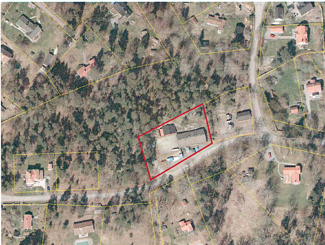
Röd linje visar fastigheten Vadet 3:240.

Planavdelningen föreslår att kommunstyrelsen ger stadsbyggnadsnämnden i uppdrag att arbeta fram en detaljplaneändring för Vadet 3:240. En antagen detaljplan för Vadet 3:240 bedöms kunna vara antagen år 2016.