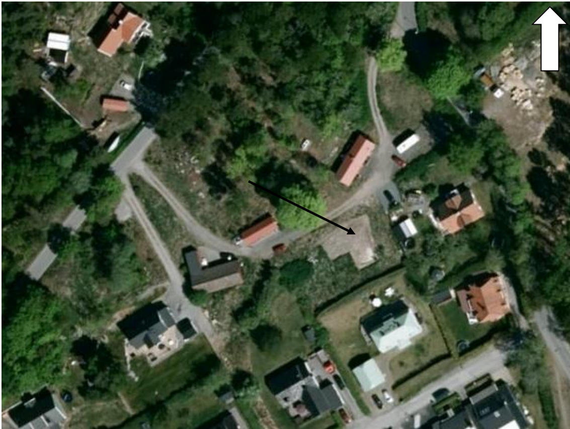
Figur 2. Flygfoto åtgärdat område (grusad yta) vid pil