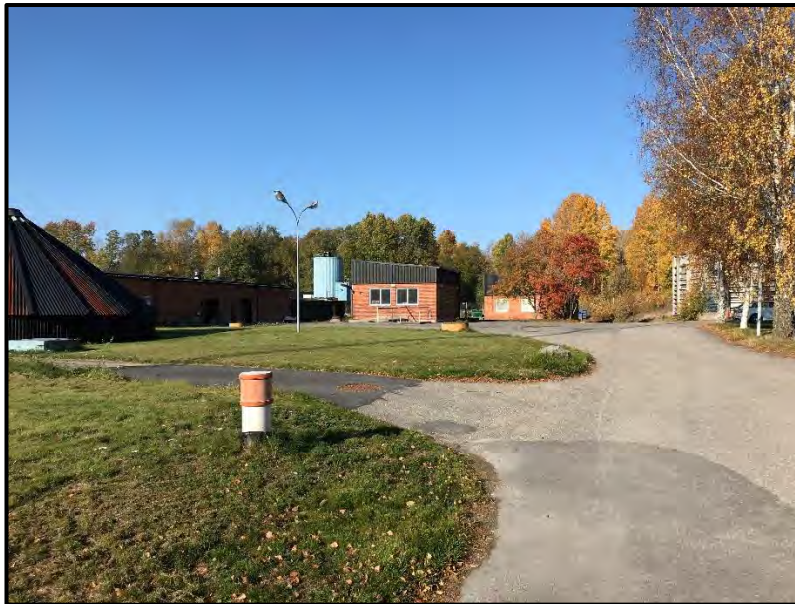
Figur 2 Gräsmark och hårdgjorda ytor i södra delen [2].