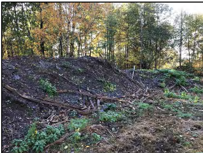
Figur 3 Schaktmassor centralt i norra delen [2].

Områdets norra delar består av mindre tät skogsmark med lövträd. Centralt i norra delen upptäcktes ett upplag för schaktmassor med okänt ursprung, se figur 3. Enligt nivåkurvor på grundkarta och avvägningar från sonderingspunkter varierar marknivåerna mellan +28 och +24 med svag sluttning mot Vitsån i väster.