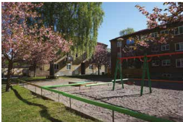
Lekplats mellan flerbostadshusen.

Karaktäristiskt för rekordärens bostadsområden är att bebyggelse och grönområden planerades som sammanhängande områden och att allt mer hänsyn togs till barns behov och säkerhet.