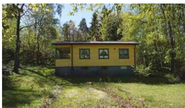
Sportstuga med den typiska stockpanelen och öppen altan, Dalen. Tomten har en långsmal form och naturmarken med många träd är till stor del bevarad (Vendelsö 3:47).