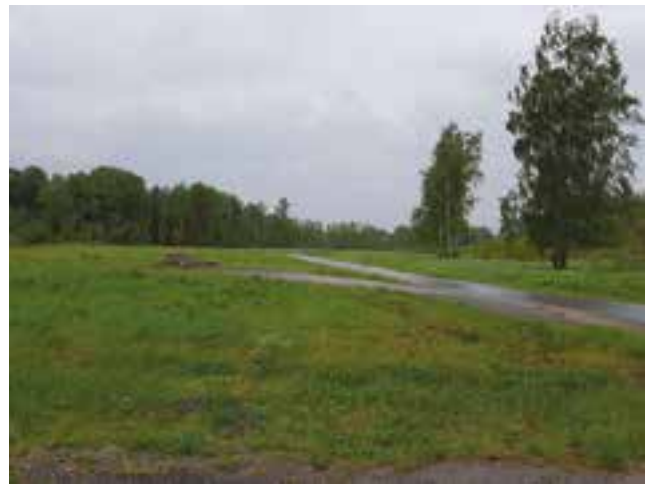
Det öppna landskapet vid Signeborg.