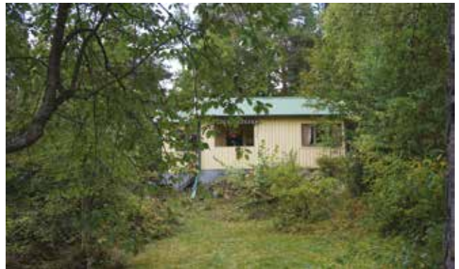
Gudö 3:326.

Gudö 3:326 (3m) är en sportstuga med den typiska öppna altanen. Väggarna är klädda med locklistpanel och sadeltaket med korrugerad plåt.