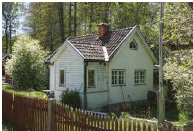
Stuga längs med Hagtornsvägen, Dalen. Spjälstaketet har ett högt miljöskapande värde (Vendelsö 3:1213).

På fastigheten Gudö 3:64 (3i) finns en villa med utformning typisk för tidigt 1900-tal gällande bland annat färgsättning och småspröjsade fönster. Tomten är kuperad och avgränsas mot vägen av en syrenhäck.