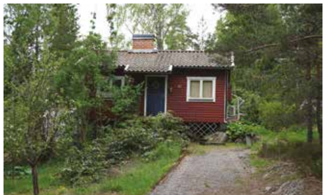
Gudö 3:445.

Gudö 3:445 (3q) - Stuga som bland annat karaktäriseras av väggarna klädda med stockpanel, sadeltak klätt med enkupigt tegel, trappa med smidesräcke samt fönstrens form och placering. I trädgården finns bland annat syrener och sparad naturmark med berg i dagen och tallar.