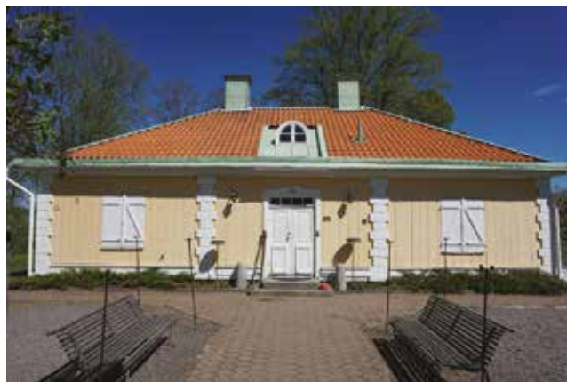
Den södra flygeln som uppfördes under tidigt 1800-tal. Idag fungerar den som bygdegård.