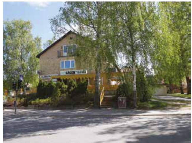
Det första flerbostadshuset som uppfördes i Sågen.