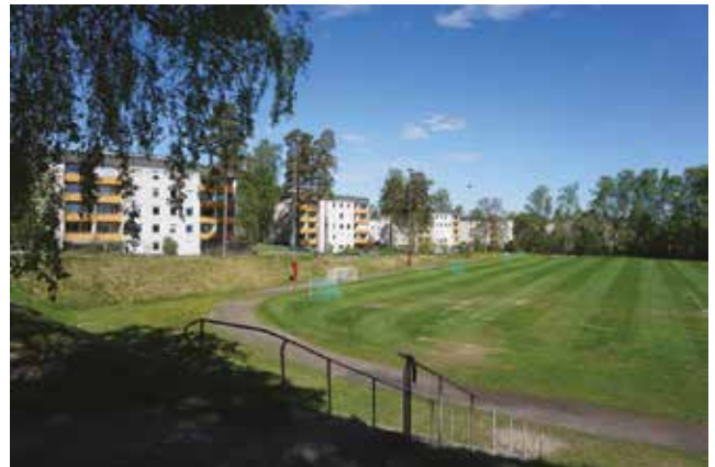
1970-talets bebyggelse i Sägen. Byggnadernas placering och höjd anpassades efter platsens befintliga vegetation, bl a tallar som syns på bilden. I förgrunden syns HaningevalLEN.