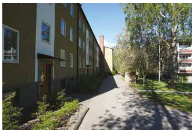
Trapphusen är markerade genom vita fält i fasaden.