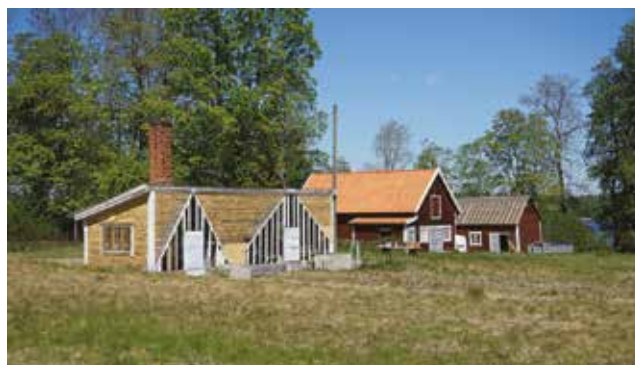
Byggnad med spår i fasaden av tidigare växthus samt ekonomibyggnader från tiden som handelsträdgård.

PBL 2 kap. 6 §, PBL 8 kap. 14 § och PBL 8 kap. 17 §. Förutom de generella skydd som PBL, tillsammans med PBF, MB och KML omfattar så ska miljön, inklusive bebyggelsen, i egenskap av att den är klassad som särskilt värdefull handläggas enligt PBL 8 kap. § 13 och PBL 9 kap. § 4d.