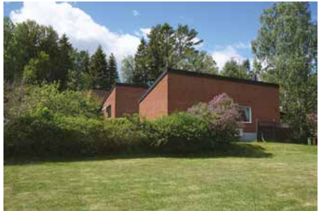
Grindstuvägen 68-80, Vendelsö 3:1232-3:1238. Välbevarade kedjehus med röda tegelfasader och tidstypiska detaljer som smidesräcken och skärmtak över entréer.