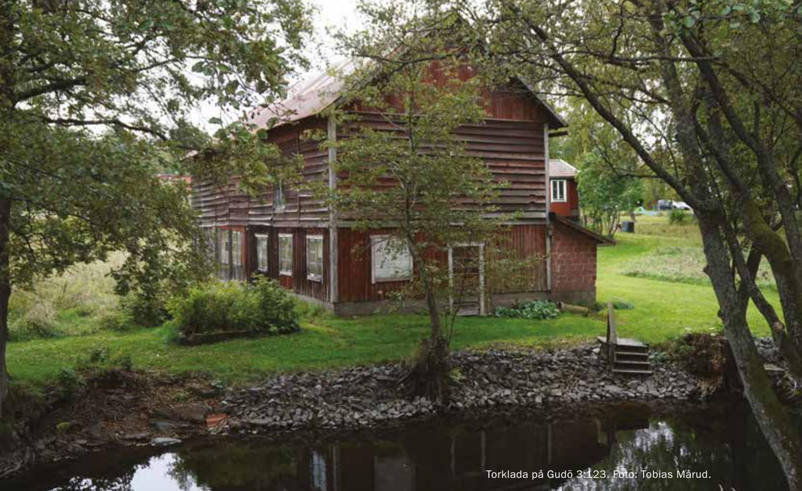
Torklada på Gudö 3:123.