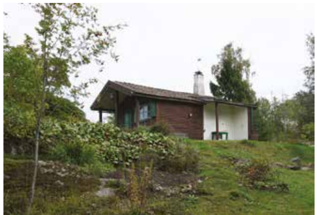
Gudö 3:478.

En sportstuga, troligen uppförd 1917 finns på Gudö 3:478 (3p). Liggande brun stockpanel, grönmålade detaljer, tegelklätt sadeltak, profilsågade snickerier och hög vitputsad skorsten med dekorativa detaljer är karaktäristiskt.