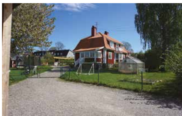
I miljön kring Vendelsö gård finns några villor från tidigt 1900-tal, här Stora Alsvik (Vendelsö 3:982).

Allén längs landsvägen är skyddad som biotop enligt miljöbalken 7 kap. 11 § som anger att det inte får inte bedrivas verksamhet eller viddas åtgärder som kan skada naturmiljön, i det här fallet allén.