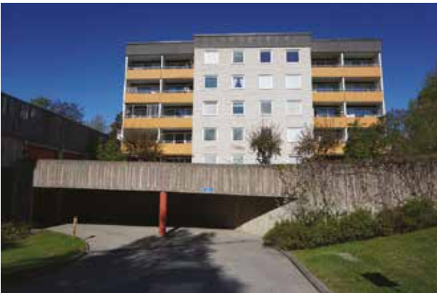
En av byggnaderna uppförd på 1970-talet, med tidstypisk utformning och detaljer som balkongfronter i orange plåt. Garageinfart med fasad av betong.