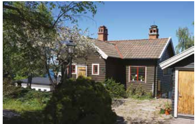
Vendelsö 19:1.

Vendelsö 19:1 (3e). Brunmålad stockpanel, blyspröjsade fönster, tegelklätt sadeltak och skorstenarnas dekorativa utformning är viktiga för byggnadens karaktär.