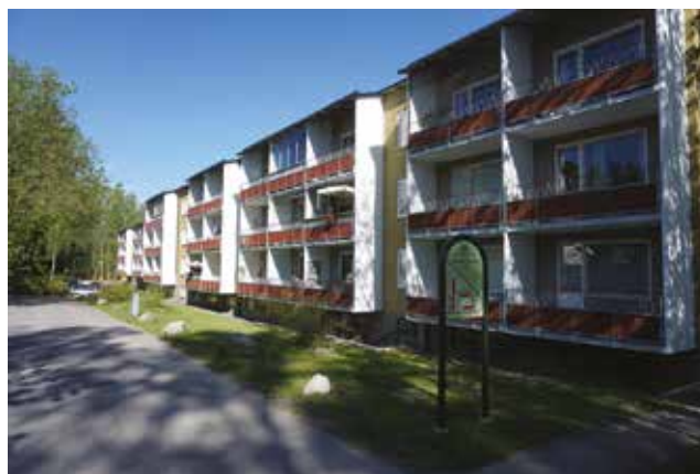
En av byggnaderna på västra sidan om Vendelsö skolväg. De utanpåliggande balkongerna med betongskärmar gör att balkongerna dominerar fasaden.