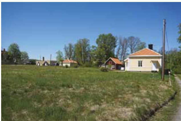
Trädgårdsmästarebostaden från 1920-talet och övriga bevarade byggnader. Den öppna gräsytan var tidigare den östra delen av trädgården vid Vändelsö gård.