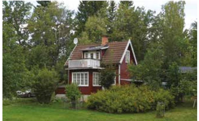
Gudö 3:110.

På Gudö 3:110 (3k) finns en villa med tidstypisk färgsättning för tidigt 1900-tal, småspröjsade fönster, tegelklätt sadeltak och indraget läge i den stora trädgården.