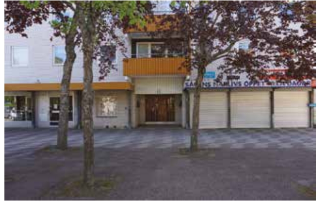
Sågens centrum med butiker i bostadshusets bottenvåning. Trädplantering och markbeläggningen är viktiga miljöskapande inslag.