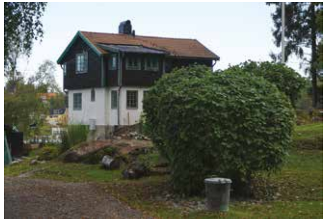
Gudö 3:333.

På Gudö 3:333 (3l) finns en villa med putsad nedervåning och utkragad övervåning klädd med liggande brun panel. Småspröjsade fönster, i vissa fall blyinfattade, med grönmålade snickerier. Exempel på en villatyp som förekom under 1920-talet. Inspirationen till den här villatypen kom från Ornässtugan i Dalarna.