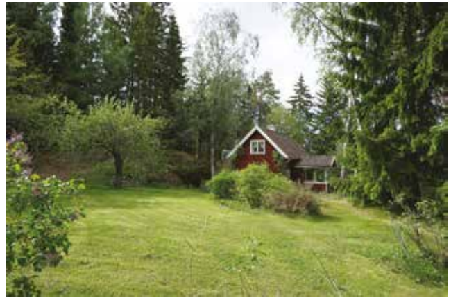
Tutviken 1:3.

Tutviken 1:3 (3r) - tomten avstyckades 1925 och bebyggdes med en stuga med liggande panel och vitmålade detaljer, sadeltak klätt med tegel, och farstuvist med svarvade stolpar. På den stora tomten finns fruktträd och syrener.