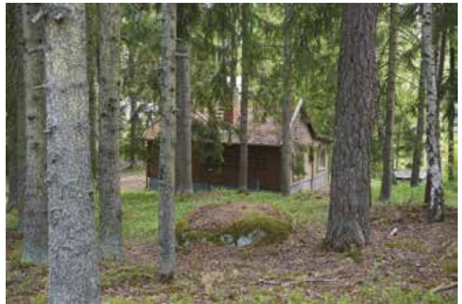
Tutviken 1:39. Foto: Tobias Mårud

Tutviken 1:39 (3t) - Sportstuga som nästan döljs av tomtens alla tallar. Karakteristiskt är den brunmålade stockpanelen med gröna detaljer, fönsterform och placering, pappklätt sadeltak och den höga skorstenen.