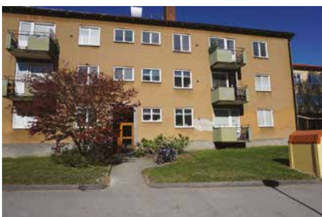
Byggnaden har en tidstypisk utformning med bl a putsad fasad och balkonger med sinuskorrugerad plåt och räcken i smidesjärn.