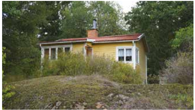
Gudö 3:331.

En sportstuga högt belägen på tomten finns på Gudö 3:331 (3n). Karaktäristiskt är altanen, stockpanelen och fönster över hörn.