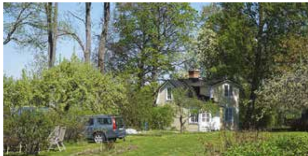
Vendelsö 3:55, Östra Strandvägen.

Vendelsö 3:55 (3a) styckades av 1908 och såldes till hattmakaren Johan Sigfrid Karlsson och snickaren Karl Johan Karlsson, Stockholm. Viktigt för villans karaktär är väggarna klädda med liggande gul träpanel, plåttäckt mansardtak, spröjsade fönster och skorsten med utkragat krön samt läget en bit in i trädgården. I trädgården finns fruktträd.