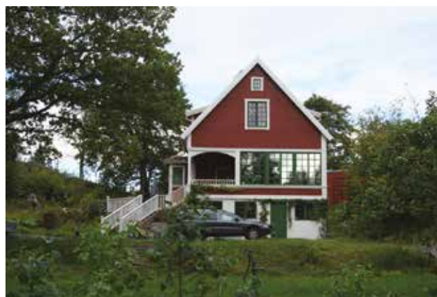
Gudö 3:64.