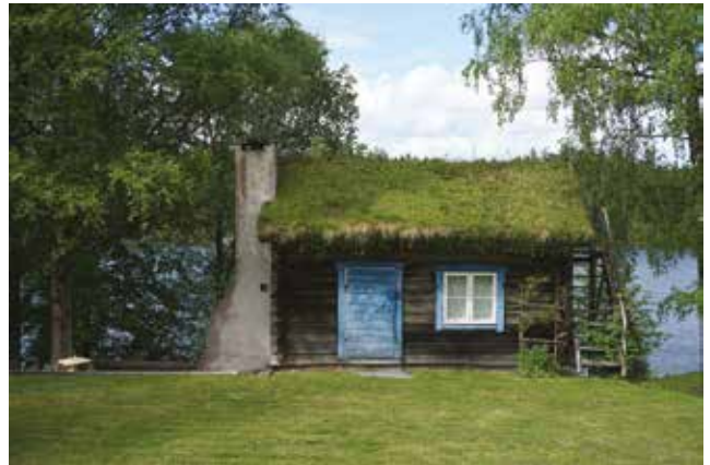
Tutviken 1:29.

Tutviken 1:29 (3s) - Liten timrad stuga med utanpåliggande murstock och grästäckt tak vid Långsjöns strand.