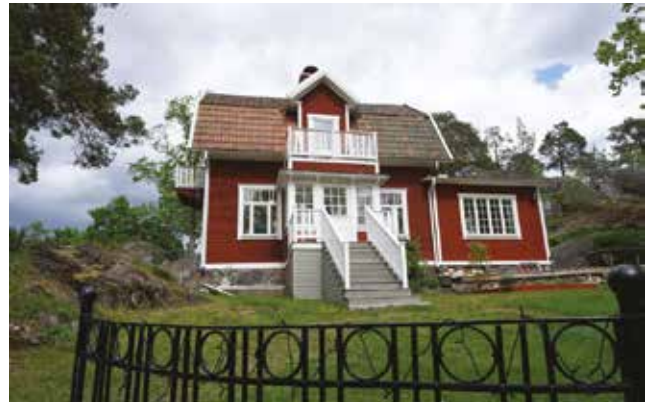
Vendelsö 3:78.

Vendelsö 3:78 (3d), en av de tomter som styckades av och såldes 1908. Villan är högt belägen i terrängen. Naturstenssockel, liggande träpanel, fönster med småspröjsad övre del och brutet sadeltak klätt med tegelpannor är karaktäristiskt.