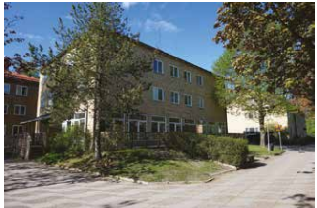
Byggnad med verksamhetslokal i bottenvåningen.