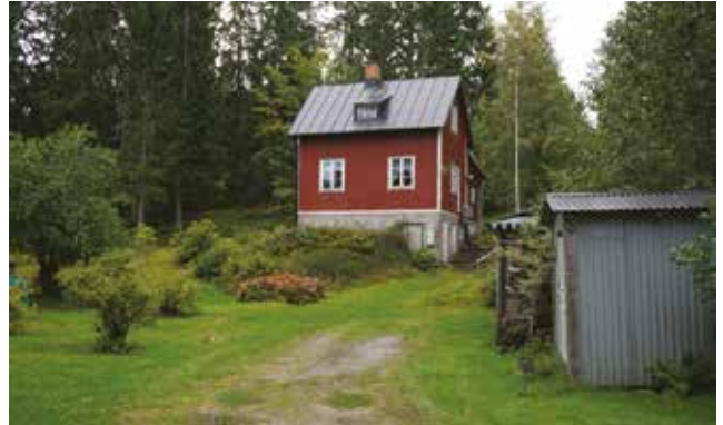
Gudö 3:68.

Stora tomter med byggnaderna indragna från vägen är typiskt i området. Ett exempel är Gudö 3:68 (3j). Viktigt för byggnadens karaktär är den liggande träpanelen, ursprungliga fönster, sadeltak, källarvåning samt byggnadens enkla uttryck och fasad utan tillbyggnader mot vägen.