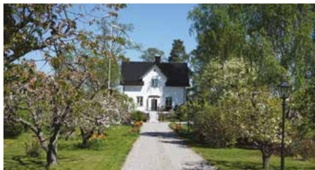
Vendelsö 3:57, Östra Strandvägen.

Vendelsö 3:57 (3c) har den avlånga formen på fastigheten bevarad, med en rak grusgång kantad av fruktträd som leder fram till den vitputsade villan. Byggnaden är förändrad med bl a ändrat takmaterial.