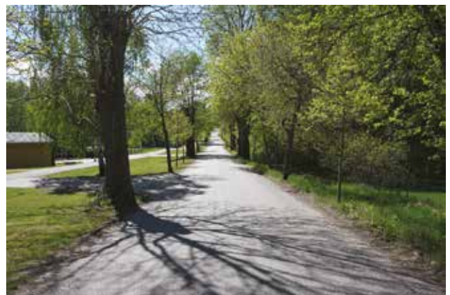
Vägen söderut från Vändelsö gård, delvis kantad av allén från sent 1800-tal.