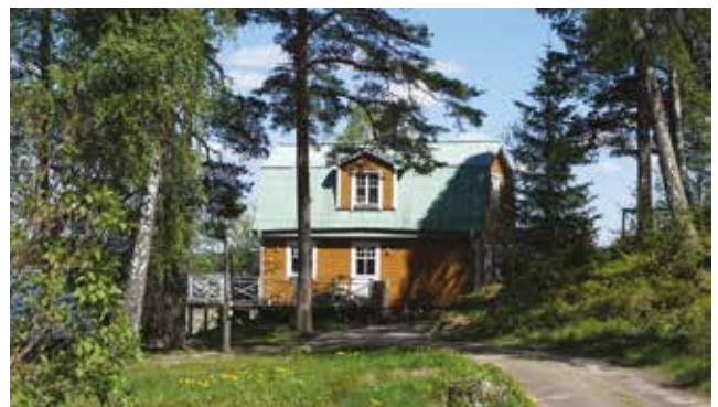
Vendelsö 3:36.