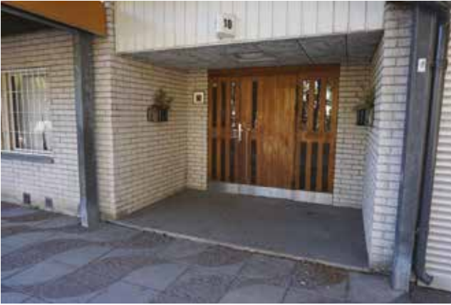
Entré till flerbostadshus, tidstypiskt indragen från fasaden och med ursprungliga dörrar.