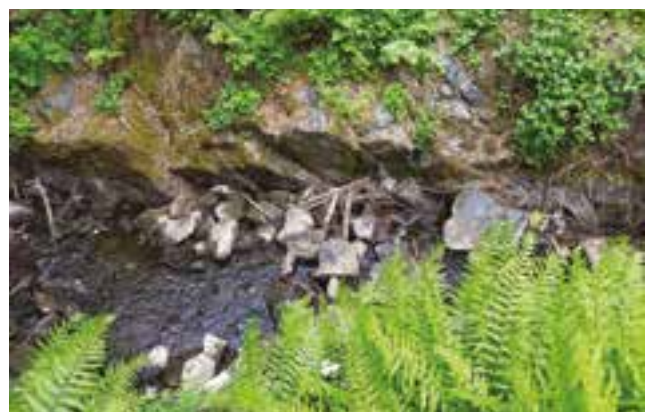
Miljön kring det gamla kvarnområdet.