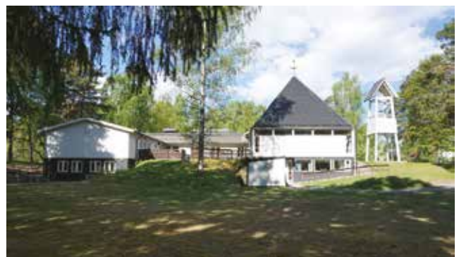
Vendelsö kyrka från 1967.

Kyrkan var ursprungligen rödfärgad, men omgestaltades 2005 och fick då den nuvarande vita färgsättningen. En klockstapel står nordväst om kyrkobyggnaden.