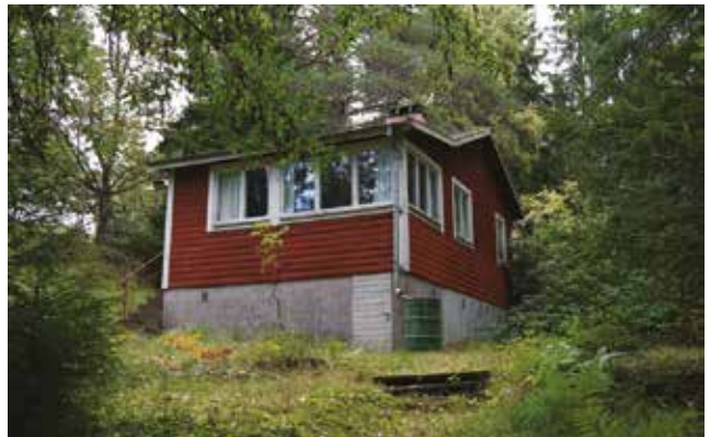
Gudö 3:321.

På Gudö 3:321 (3o) finns en sportstuga med källarvåning, väggar klädda med stockpanel, ursprungliga fönster, trappa med smidesräcke och skorsten med dekorativa detaljer.