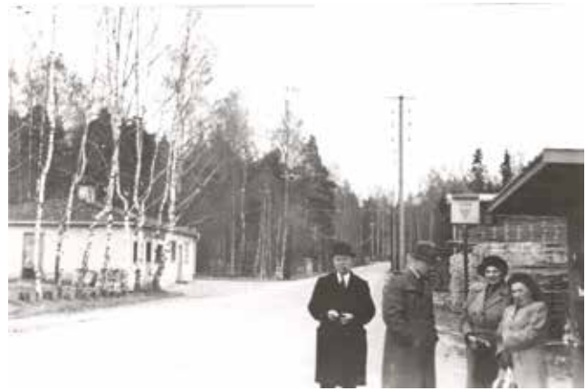
Sågen 1949.

Vid Gudöans södra strand finns en koncentrerad kulturmiljö präglad av bebyggelse, blandbruk och småindustri bevarad från första hälften av 1900-talet. Det är en miljö som på många sätt är typisk för Haninge under perioden. Här finns det största antalet bevarade torkklador i Haninge och Stockholms län. Tvätternäringen var den enskilt viktigaste näringen för Österhaninge, möjligen för hela Haninge, under första hälften av 1900-talet. Här finns ytterligare bebyggelse som redovisar småjordbrukets behov av variation och tillvaratagande av inkomstmöjligheterna i form av jordbrukets ekonomibyggnader, en före detta mekanisk verkstad och rester av äldre bryggor vid åstranden, tillsammans med de äldre bostadshusen. Genom området gick tidigare den gamla landsvägen vars upphöjda vägbank ännu tydligt syns löpa fram till brofästet vid ån. Anknypningen till kommunikationerna, landsvägen, järnvägen och färjetrafiken är ytterligare ett inslag som på ett pedagogiskt sätt redovisar en typisk etablering av bebyggelse i Haninge.