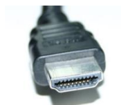
Figur 4 HDMI-kontakt

Kontaktperson: Linda Wikander, Tele: 08-606 81 25