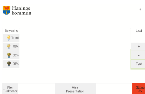
Figur 2 Huvudsida