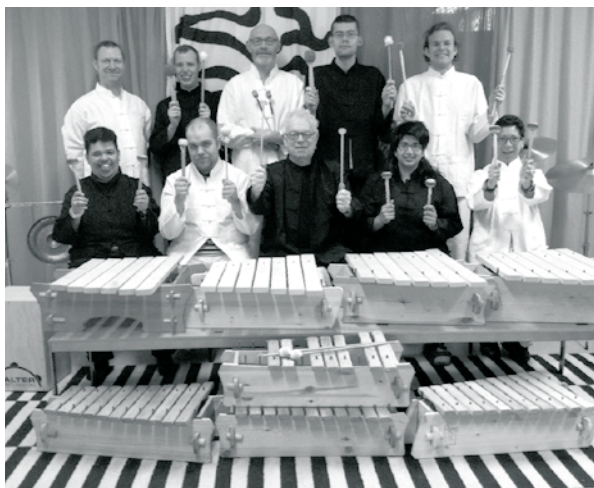
Xylofonorkestern spelar i Haninge kulturhus fredagen 3 februari kl 12.30. Passa också på att gå på vernissagen i konsthallen.

Haninge kulturhus, konsthallen och caféet