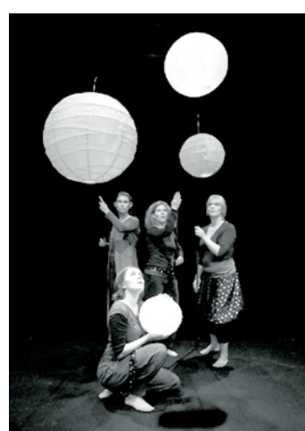
Familjelördag 25 februari med rymdteater och rymdverkstad.

Huvudarrangör: Haninge kultur. Medarrangör: Haninge Riksteaterförening.