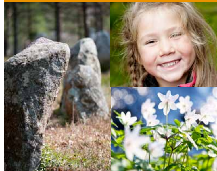
Illustrationer: Gunnel Wigén. Tryck: 2012, Haninge kommun

Upptäck ett av Sveriges största järnåldersgravfält!